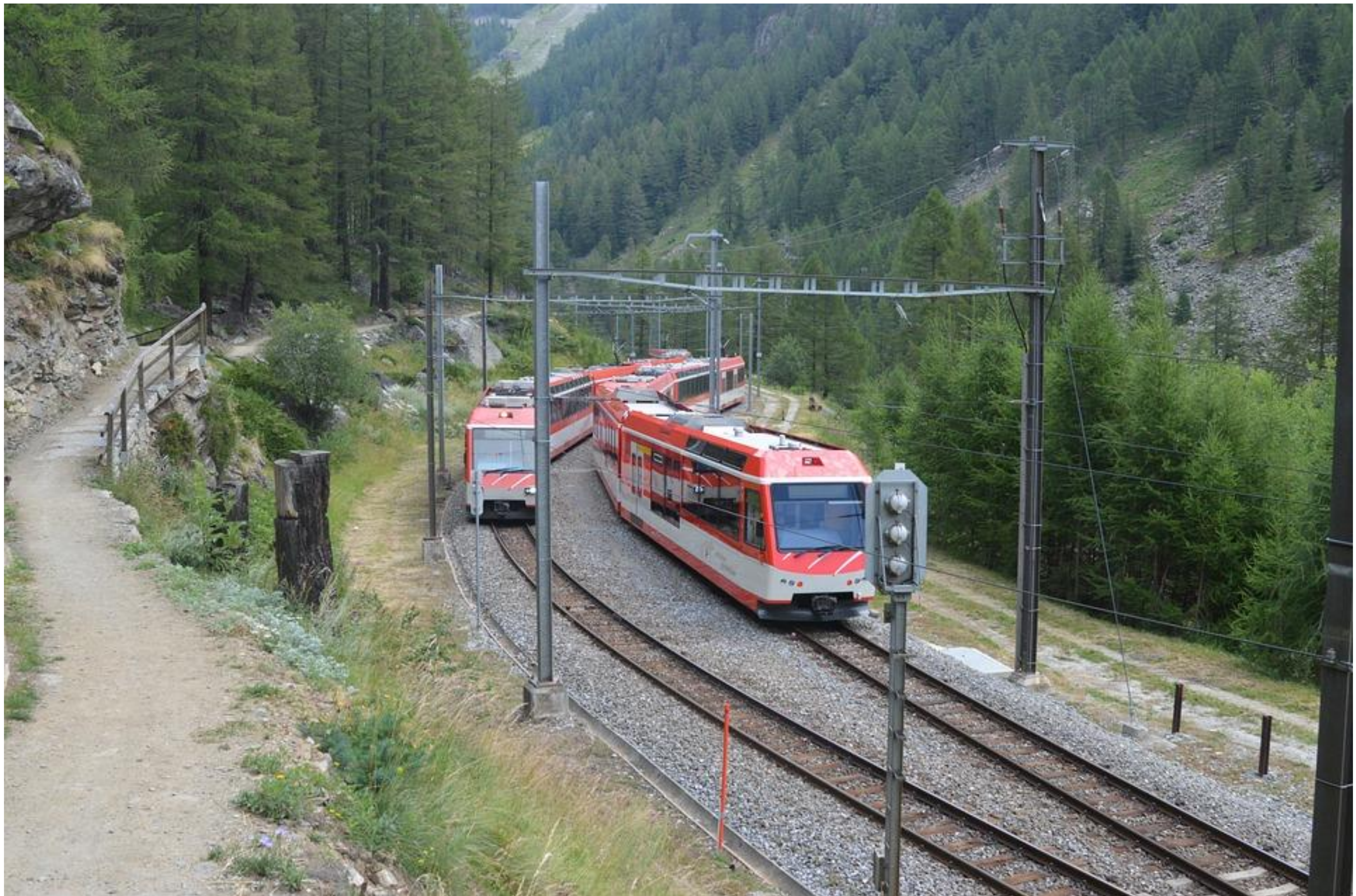
Imagen de uso libre y sin fines comerciales